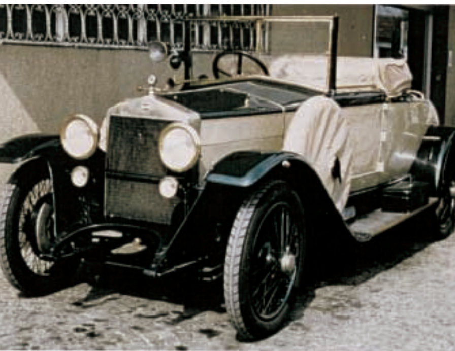
La Diatto 20 S del 1924 - Cabriolet Schieppati - Milano

"Tanti, ma in particolare l'amicizia di Ernesto Maserati e Giuseppe Coda, che oltre tutto mi guidarono nel restauro della mia Diatto 20 S, e il dono che mi fece quest'ultimo degli occhiali che Alfieri Maserati gli regalò dopo la prova "entusiasman-te" - 180 Km/h - con la 8 C il 14 Giugno 1925 alla Coppa del Re, insieme a tanta documentazione. Ricordo con emozione la prima uscita in strada della mia Diatto per le vie della Brianza con un pilota d'ecce-